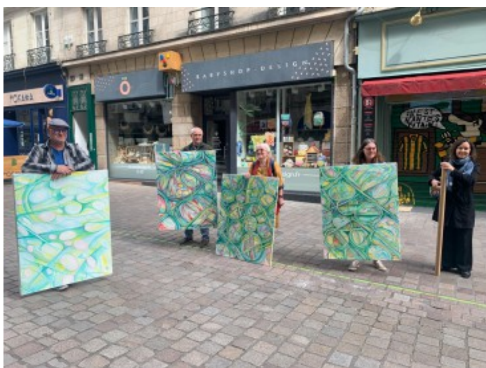
Atelier peinture et création du décor pour la pièce de théâtre “Le ciel au dessus de Berlin” avec 17 jeunes de St Brevin, mai 2024