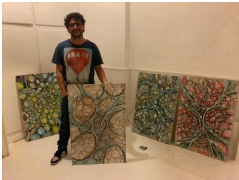
Action collective : "Je me balade avec mes peintures" en centre ville de Nantes, avril 2024