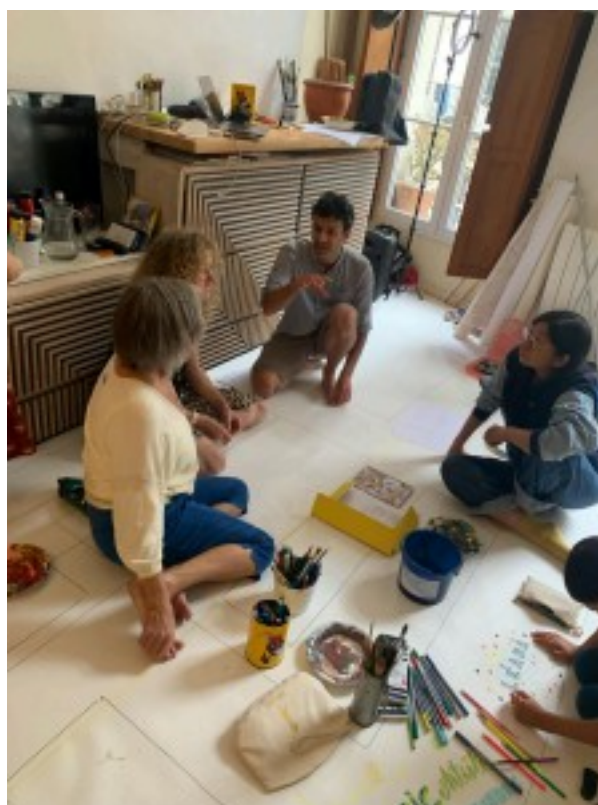
Coopération avec l'association Musique pour tous à la Maison Quartier la Locomotive à la Halvêque, juin 2024